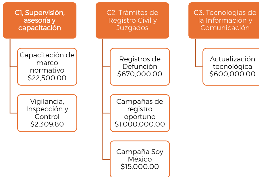
Esquema 1. Vinculación de componentes con acciones del Convenio