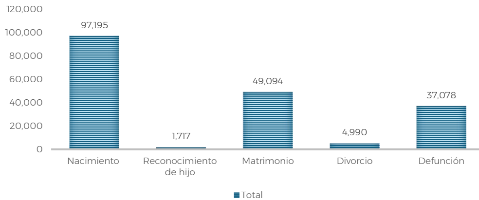
Gráfica 2. Registro de actas en el Estado de Puebla